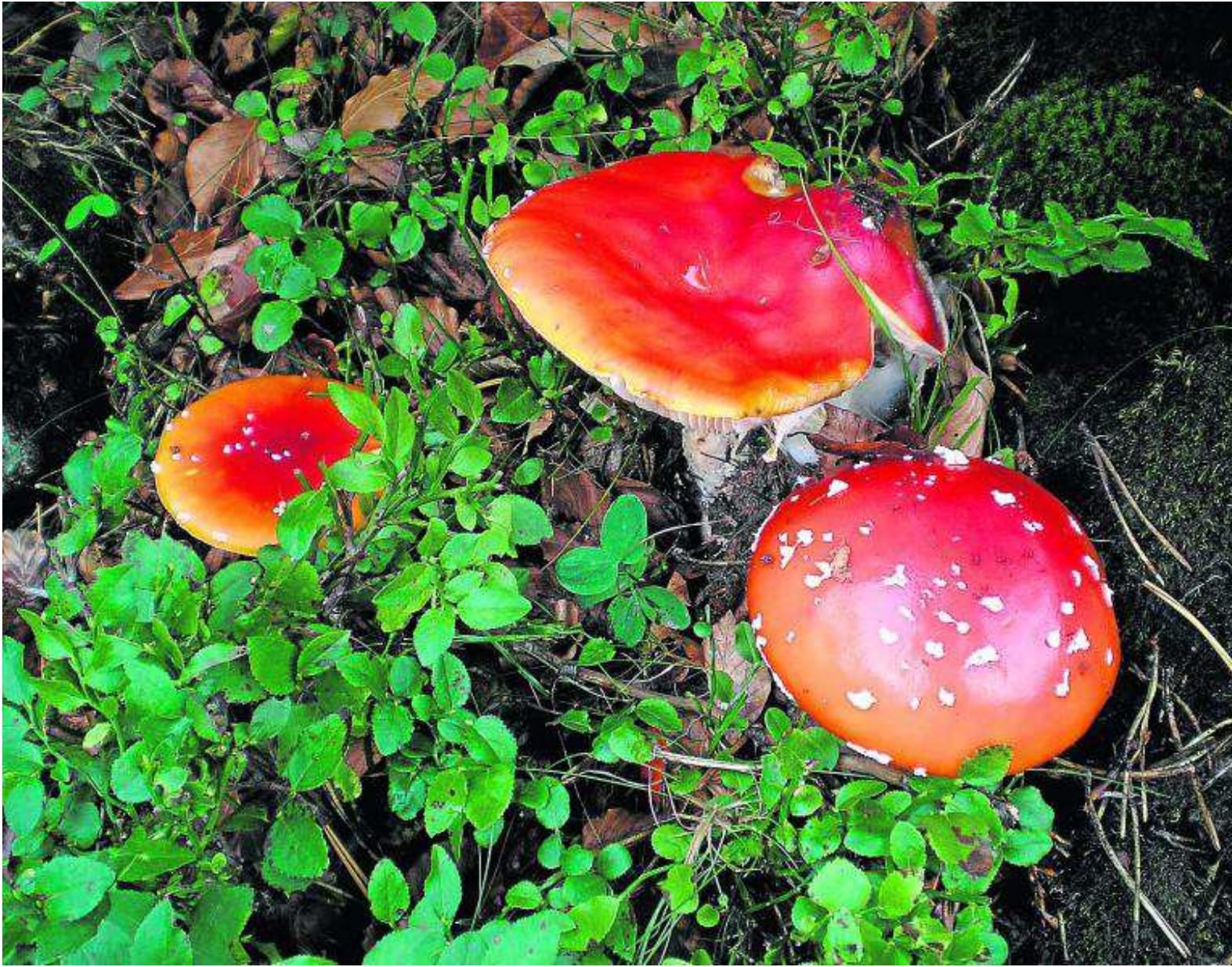
La venenosa Amanita muscaria es una de las setas más atractivas. PRAMES