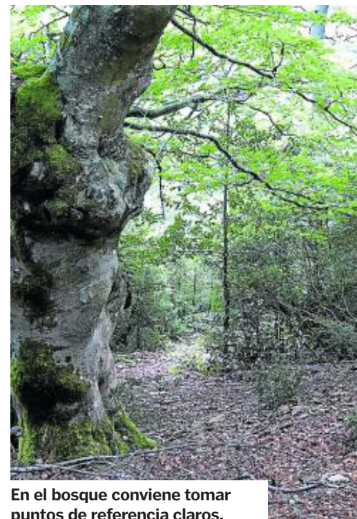
En el bosque conviene tomar puntos de referencia claros. PRAMES