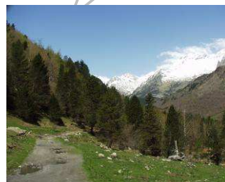
Valle de Estós

Para llegar al final de nuestro recorrido debemos continuar aproximadamente 40 minutos más, siguiendo las señales direccionales que nos conducirán por una pequeña senda hasta el impresionante ibón de Escarpinosa.