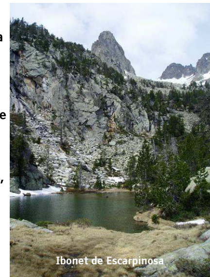
Ibonet de Escarpinosa

Dejamos la amplia pista del fondo del valle (GR 11) y tomaremos el desvío hacia el ibonet, cuya senda asciende por un frondoso bosque hasta encontrarnos con un diminuto lago en una zona de praderas, es el ibonet de Batisielles.